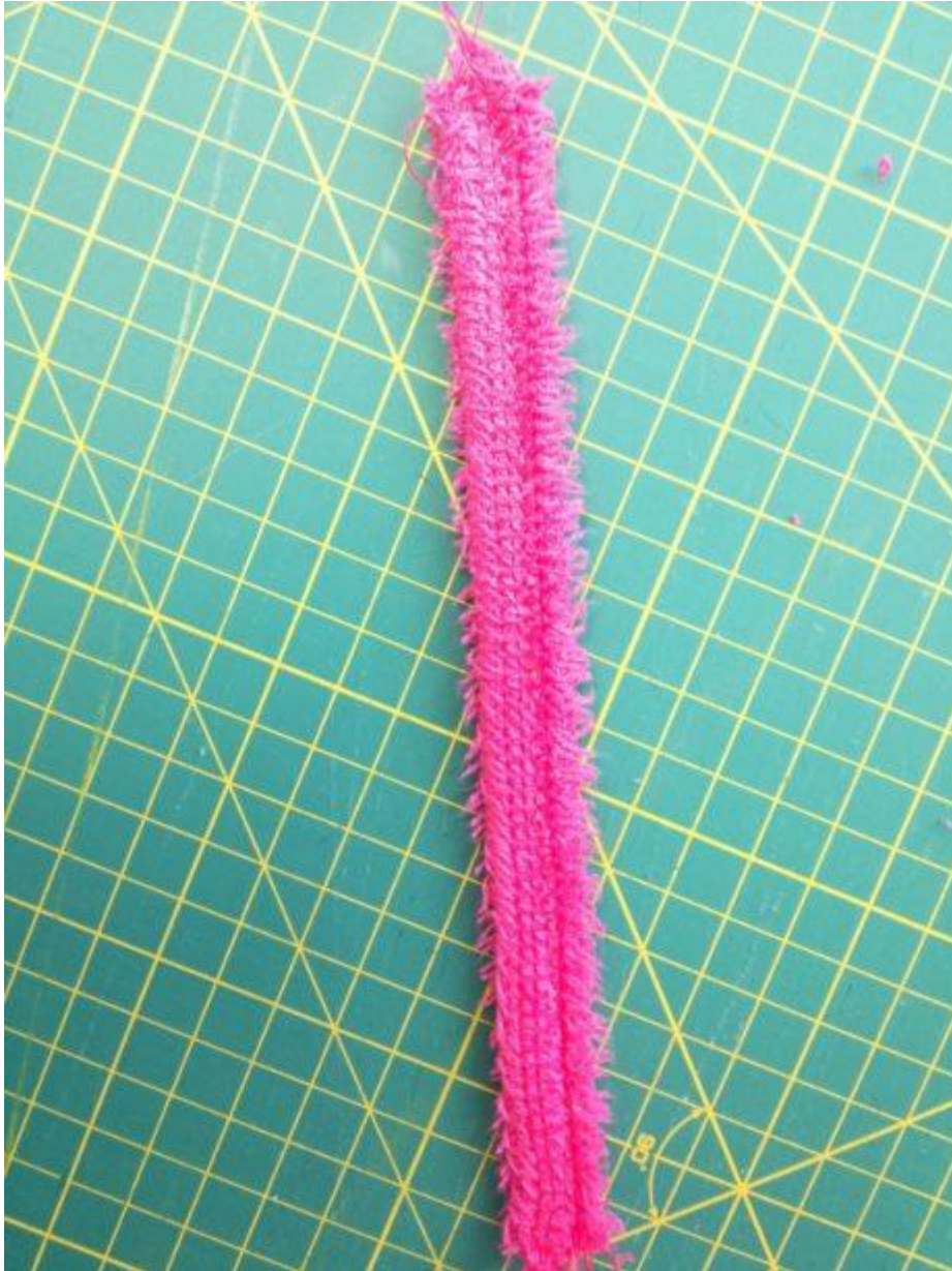
17. Z LS prošijte