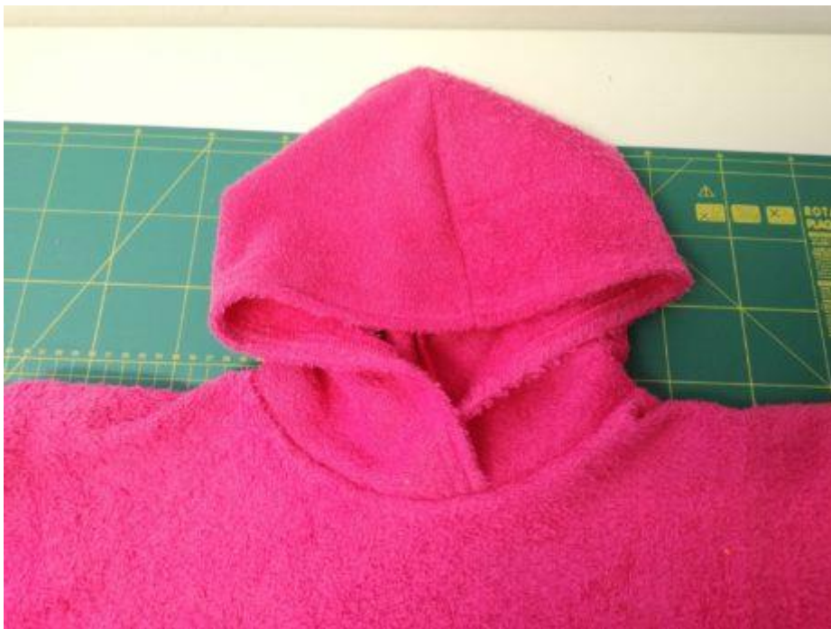
14. Našitá kapuce