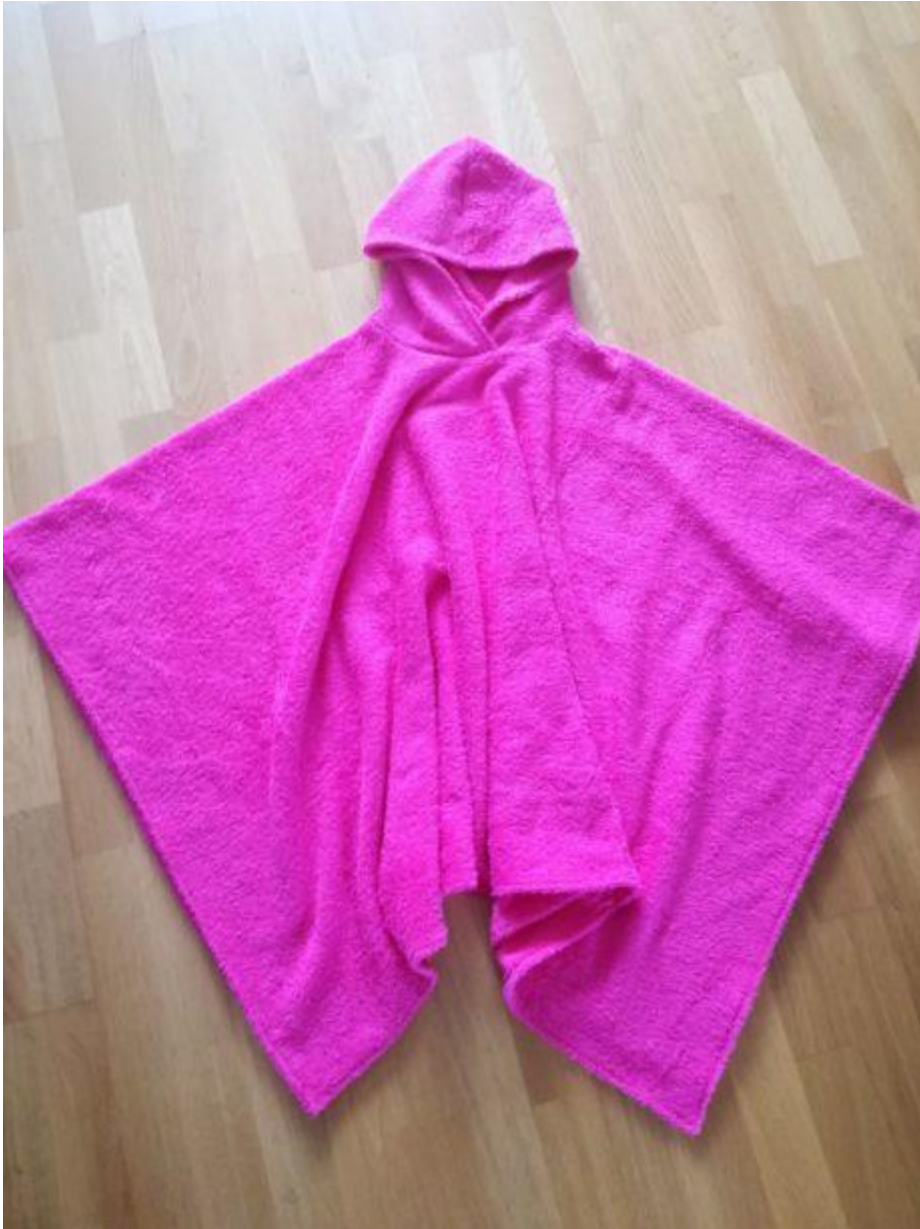
20. A osuška je hotová