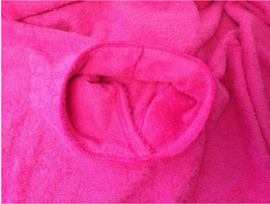
13. Kapuci našijte